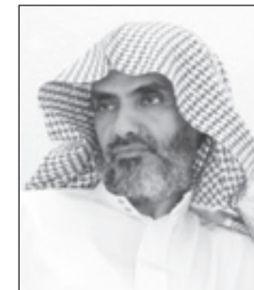
ناصر بن محسن بن لؤي

أولاً واحترام الأسرة الدولية والإسلامية وإنجازاته العظيمة لا حصر لها والتي توجت بقراراته الكريمة على شعبه ولم يكن هذا مستغرباً وقد حمل همومهم وهو بعيد وباتسرها ومناقبته لأحوال المواطنين وهو في فترة النقاهة وما نحن نراه اليوم وبيننا ويسأل عنا ويرينا تواضعه بالسؤال عن أحوالنا فرداً فرداً كبيراً وصغيراً يحفظه الله من كل مكروه وأدام عافيته وعزه . وقال الشيخ مطلق بن ناصر الدهاسي العامري عضو المجلس البلدي في الخرمة : نحمد الله أولاً على سلامة خادم الحرمين الشريفين والد الجميع ونحمده على عودته إلى أرض الوطن سالمًا معافي . لقد عبر الشعب السعودي في صورة رائعة عن التلاحم القوي بين القيادة والشعب وهذه الصورة ناتجة عما يكنه الشعب لهذا الملك الإنسان الحنون قلبه