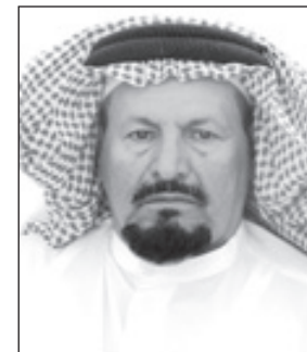
الشيخ مطلق بن ناصر الدهاسي