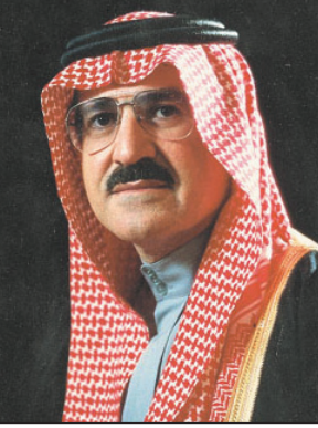
الأمير سطات بن عبدالعزيز

الرياض - خالد العوفي : ■ وجه صاحب السمو الملكي الأمير سطات بن عبدالعزيز أمير منطقة الرياض بالإبادة لجنة الدفاع المدني الفرعية بمنطقة الرياض بأخذ التدابير والاحتياطات اللازمة لمواجهة مخاطر الأمطار والسيول المحتملة . حيث عقدت لجنة الدفاع المدني الفرعية بمنطقة الرياض اجتماعاً استثنائياً بحضور أمين منطقة الرياض الأمير د. عبد العزيز بن محمد بن عياف آل مقرن والجهات ذات العلاقة للوقوف على الاستعدادات والاحتياطات اللازمة لمواجهة أخطار السيول في حال حدوثها لإسماج