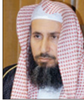
الدكتور محمد الرشود

سيول جدة ظهر فيه ما اعتدناه منه -حفظه الله- من وقفة صادقة ضد الفساد وتشخيص للمشكلة وإنسانية ومشاعر مفرطة وتأثر وألم بما حصل للمواطن والمقيم من مأساة وشاعرية وتم عن خوفه من الله سبحانه وتعالى وقيامه بالواجب الشرعي ومشاركته لأسرة كل غريق في أحزانه ، ووقوفه معهم وقفة رجل صادق مخلص ، والأمر الملكي فيه من البعد الإداري والنظامي الذي يحقق بحول الله تعالى العدالة وعدم تكرار المشكلة وتذكير القائمين على اللجنة بالله استشعاراً للأمانة والمسؤولية ، مختتماً بالقول : إن هذه البصمة الملكية ستبقى وثيقة يضي على نهجها المسؤول تذكيراً بقوله صلى الله عليه وسلم "كلكم راع وكلكم مسؤولون رعيته" .