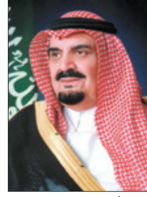
الأمير مشعل بن عبدالعزيز

الرياض - واس : ■ يصل بحفظ الله ورعايته صاحب السمو الملكي الأمير مشعل بن عبدالعزيز رئيس هيئة البيعة إلى مطار الملك خالد الدولي بالرياض اليوم الخميس في تمام الساعة الثانية عشرة والنصف ظهراً قادماً من بيروت بعد اكتمال رحلة سموه للعلاج وتماثل صحته بحمد الله وفضله للشفاء التام. حفظ الله سموه في سفره وإقامته وأسبغ عليه لباس الصحة والعافية .