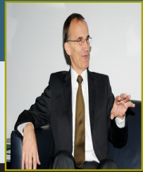
السيد فولكمار فينيستل

قام وفد من السفارة الألمانية بالمملكة العربية السعودية بزيارة للجمعية الوطنية لحقوق الإنسان بالمركز الرئيسي بالرياض ، وذلك يوم الأحد ٣/٣/١٤٢٢ هـ الموافق ٦/٢/٢٠١١ م ، وقد ضم الوفد كلاً من السيد/ فولكمار فينيستل سفير دولة ألمانيا لدى المملكة والسيد / ستيفان تشيك مستشار سياسة وثقافة .