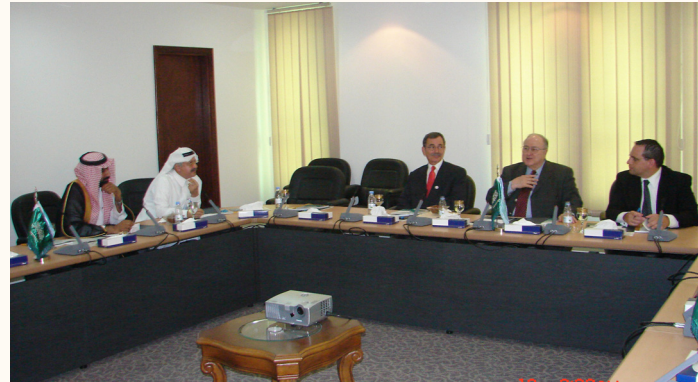
الوفد خلال زيارته لمكتب الجمعية في الرياض

الرياض - واس، حقوق: استقبال خادم الحرمين الشريفين الملك عبدالله بن عبدالعزيز آل سعود -حفظه الله- في مكتبه بالديوان الملكي في قصر اليمامة في الخامس عشر من شهر ربيع الثاني وفداً من اللجنة الأمريكية العربية لمكافحة التمييز برئاسة السناتور السابق جيمس أبو رزق.