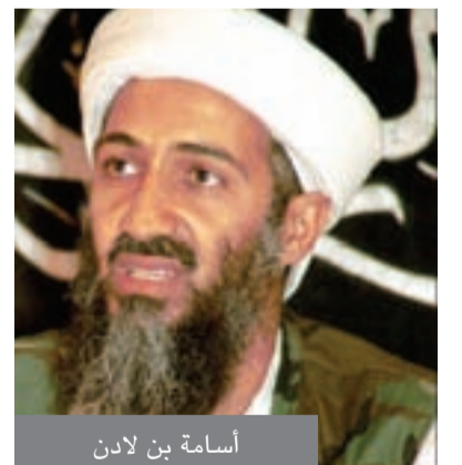
أسامة بن لادن

وجاء نشر الوثائق تزامنا مع الذكرى الاولى لقتل بن لادن في عملية شنتها القوات الامريكية الخاصة على مخبئه في ابوت اباد.