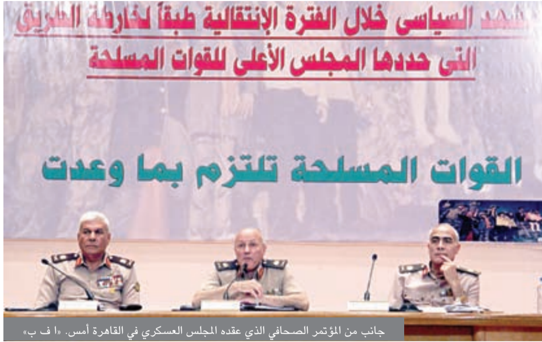
جانبا من المؤتمر الصحفي الذي عقده المجلس العسكري في القاهرة أمس.

وبحسب بيان اللجنة، فإن المرشحين الثلاثة خرقوا قانون الانتخابات الرئاسية، وأقاموا مؤتمرات انتخابية في كل من جامعة الأزهر فرع أسيوط، وجامعتي أسيوط والمنصورة.