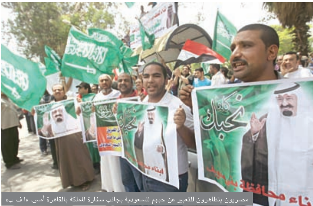
مصريون يتظاهرون للتعبير عن حبهيم للسعودية بجانب سفارة الملكة بالقاهرة أمس.

حوالي 45 من البرلمانيين المصريين، مضيفة أنه ولأول مرة سيسافر الوفد بدون تأشيرات دخول للسعودية بعدما تم وقف منح التأشيرات للمصريين بعد غلق السفارة وقنصليتي المملكة في مصر.