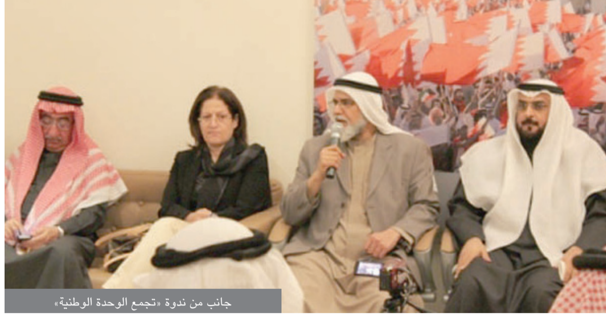
جانب من ندوة «تجمع الوحدة الوطنية»

سوط العائلة الحاكمة عليها والعمل على النهوض بالمجالس التشريعية ومراقبة نظيراتها التنفيذية والقضائية. إلى ذلك، رد البذال على سؤال طرحة أحد الحاضرين أكد فيه ان الاتحاد الكونفدرالي كان نابعا من صدق مشاعر المواطنين نسبة الى مدى استراشقاها من الفائدة التي تتحصل عليها من اقامة الاتحاد، مشيراً إلى أن المستفيد الأول من إقامته هم الأسر الحاكمة بالدرجة الأولى ثم رجال الأعمال الذين سيشهدون عهد مشرق من الازدهار الاقتصادي نتيجة انفتاح الاسواق والحدود وحرية التنقل والسفر أما الفئة الثالثة المستفيدة هم شعوب المنطقة مستنبتاً هذا من عدة تكتلات استفاد مواطنيها من المزاي التي ضمنها الاتحاد.