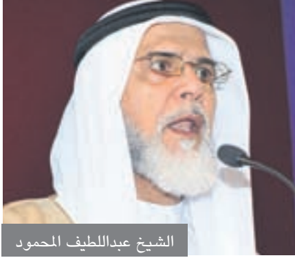
الشيخ عبداللطيف المحمود

قال الشيخ الدكتور عبداللطيف المحمود في خطبة الجمعة « لقد فرح أهلنا في دول مجلس التعاون الخليجي بالدعوة التي أطلقها خادم الحرمين الشريفين في اجتماع القادة (32) قبل أيام للانتقال من التعاون إلى الإتحاد بعد أن اتضحت لكل ذي عقل معالم الخطر الذي يحيق بنا كأمة عربية وأمة إسلامية ودول خليجية من محاولات تمزيق شملنا الذي مزقه وزيراً خارجية بريطانيا وفرنسا باتفاقية سايكس بيكو قبل ما يقارب القرن من الزمان وعلما أن الفرح بهذه الدول الصغيرة لا يغني شيئاً ، وأن الاستجابة لدعوة الله تعالى بالإتحاد والتقارب فيها الخير كل الخير ، فالحمد لله الذي هدى قادتنا لهذه الدعوة الربانية ونسأل الله تعالى أن يوفقهم ومستشاريهم لتطبيق هذه الوحدة على أسس راسخة تمنع كيد الكائدين وحقد الحاقدين وحسد الحاسدين ، ولقد أدخل القادة الفرح على نفوس المخلصين من أبناء هذه الدول ومن يريدون لها الخير ، فالشكر لله تعالى أولاً على هدايته لهم ، والشكر لله تعالى على استجابتهم لدعوته ، والشكر لله تعالى على ما يوفقون إليه من لم الشمل وجمع الكلمة وحفظ البلاد وحفظ الدين وحفظ مصالح هذه الشعوب.