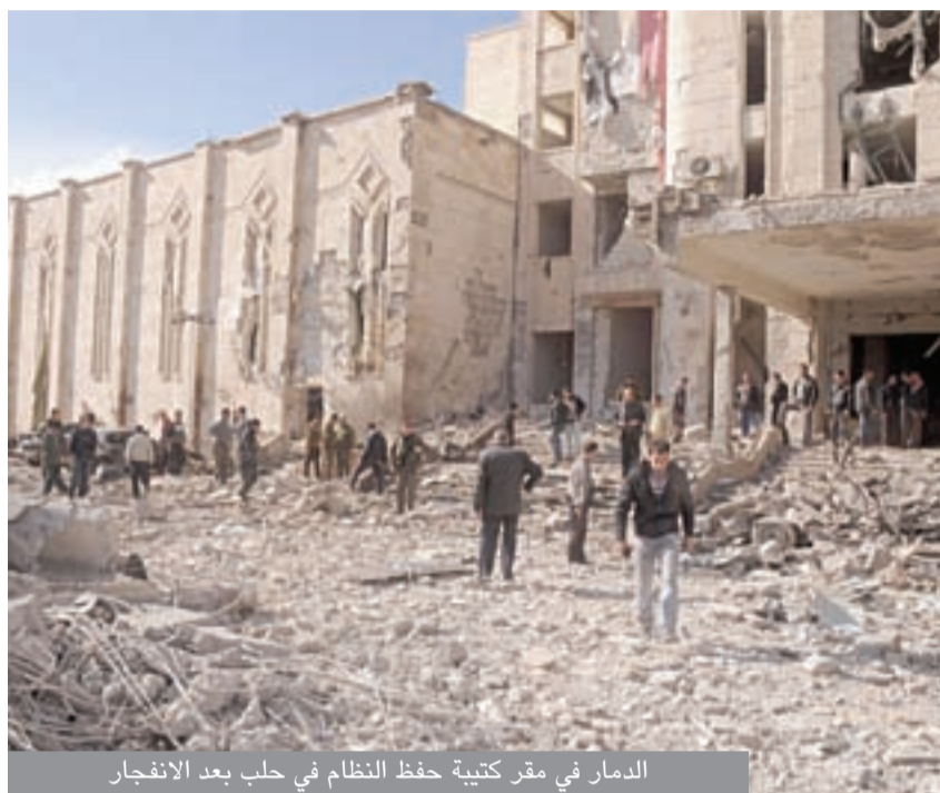
الدمار في مقر كتبية حفظ النظام في حلب بعد الانفجار

السبت 19 ربيع الأول 1433 - العدد 8342 Saturday 11th - February 2012 - No.8342