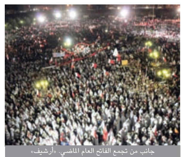
جانب من تجمع الفاتح العام الماضي «أرشيف»

يُنظم ائتلاف الجمعيات السياسية الوطنية تجمعاً حاشداً في ساحة جامع الفاتح اليوم، ويعتبر التجمع باكورة التحرك الميداني، والذي يرى المراقبون أنه عمل استباقي في المرحلة الحساسة التي تمر بها البلاد. ويشير مطلعون في الائتلاف إلى أن الخطاب الوحيد لرئيس تجمع الوحدة الوطنية الشيخ عبداللطيف آل محمود سوف يركز على أربع رسائل تتعلق بالوضع الحالي والموقف من نظام الحكم والإصلاحات السياسية، القوى السياسية الأخرى، وأخيراً رسالة للإعلام الخارجي. وتوقع المراقبون بدء الزحف الجماهيري لفعالية الفاتح 3 والتي اختير لها شعار: من أجلك يا البحرين منذ صلاة العصر. حيث من المؤمل أن يلقي الخطاب الرئيسي في الساعة الثالثة والنصف.