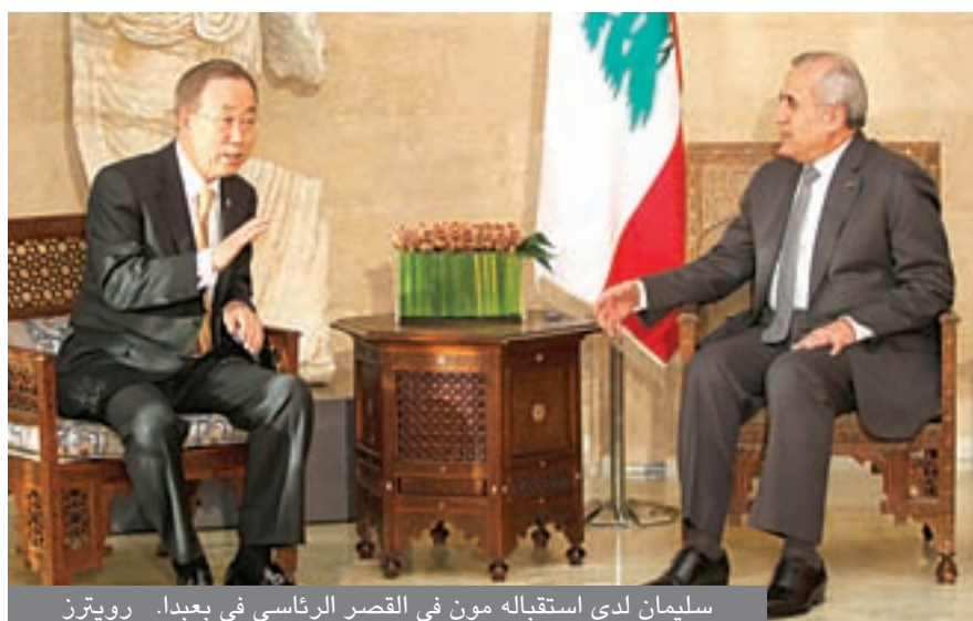
سليمان لدى استقباله مون في القصر الرئاسي في بعبدا.

الثانية من بعد الظهر وبدأ لقاءاته مع رئيس الجمهورية ميشال سليمان.