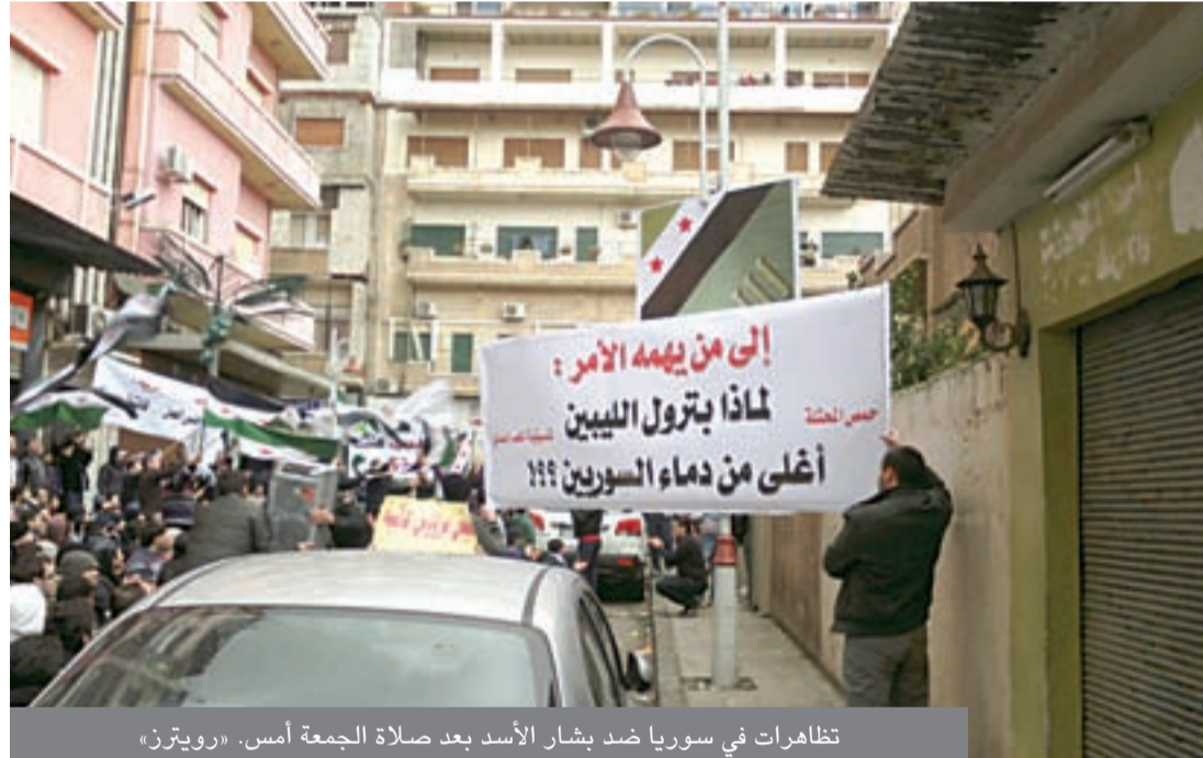
تظاهرات في سوريا ضد بشار الأسد بعد صلاة الجمعة أمس.

وقال البيان ان «وقدا من المجلس الوطني السوري برئاسة رئيسه برهان غليون التقي قيادة الجيش السوري