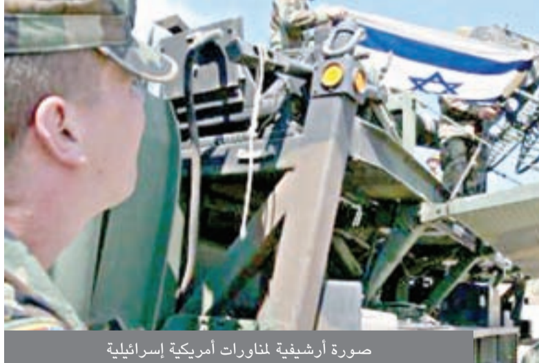
صورة أرشيفية لمناورات أمريكية إسرائيلية

الإعلام الإسرائيلية ذكرت إنها ستكون أكبر تدريب أمريكي إسرائيلي مشترك يشارك فيه آلاف الجنود الأمريكيين. تأتي هذه الأنباء وسط توترات متزايدة بين حلفاء الولايات المتحدة وإيران بسبب تهديدات طهران بإغلاق مضيق هرمز، وهو المضيق الحيوي لتجارة النفط العالمية. ولكن الجيش الإسرائيلي قال إن المناورة «تأتي في إطار دورة تدريب روتينية» وأنه تم التخطيط لها قبل التوترات الأخيرة. وأوضح الجيش في بيان له: «المناورة ليست رداً على أي تطورات عالمية.. وتمثل علامة فارقة أخرى في العلاقات الاستراتيجية بين الجانبين».