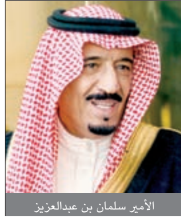
الأمير سلمان بن عبدالعزيز