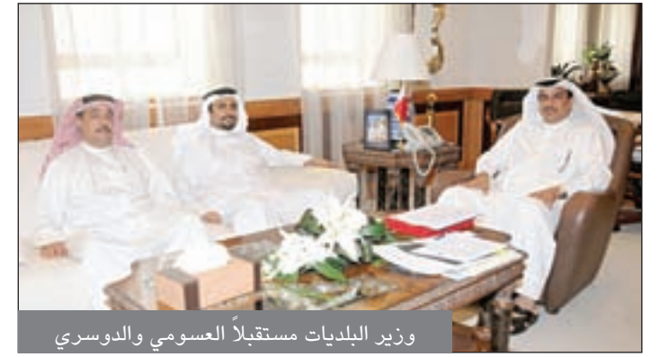
وزير البلديات مستقبلاً العسومي والدوسري

استقبل الدكتور جمعة بن احمد الكعبي وزير شؤون البلديات والتخطيط العمراني في مكتبه بديوان الوزارة عضو مجلس النواب النائب عادل العسومي وعضو مجلس بلدي المنامة عبدالعزيز الدوسري. إذ تباحث معهما في عدد من الأمور التي تدخل ضمن اختصاصات الوزارة. وأشاد الوزير الكعبي خلال الاجتماع بدور مجلس النواب في ترسيخ المشروع الإصلاحي لجلالة الملك المفدى كما أبدى استعداد الوزارة للتعاون الكامل مع المجلس وأعضائه في كافة المجالات بما يعود بالخير على مواطني مملكة البحرين.