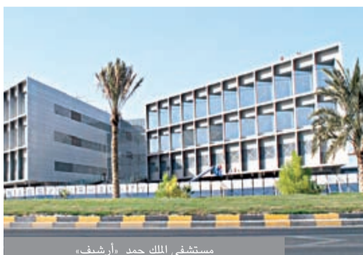
مستشفى الملك حمد «أرشيف»