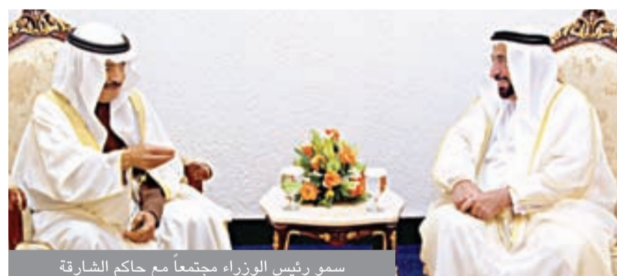
سمو رئيس الوزراء مجتمعاً مع حاكم الشارقة

اجتمع صاحب السمو الملكي الأمير خليفة بن سلمان آل خليفة رئيس الوزراء مع صاحب السمو الشيخ الدكتور سلطان بن محمد القاسمي عضو المجلس الأعلى بدولة الإمارات العربية المتحدة حاكم الشارقة، حيث استعرض سموهما العلاقات الاخوية التاريخية التي تربط بين البحرين ودولة الإمارات المتحدة وما يشهده التعاون الثنائي من نماء وازدهار ما جعل منها نموذجاً مشرفاً للعلاقات بين الدول. وخلال اللقاء هنا صاحب السمو الملكي رئيس الوزراء حاكم الشارقة بنجاح العملية الجراحية التي أجريت له مؤخرًا.