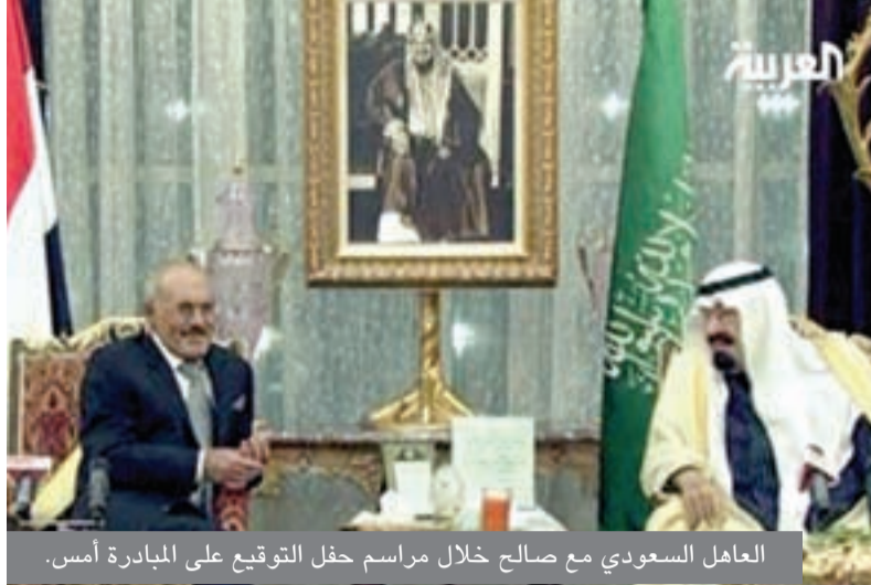
العاهل السعودي مع صالح خلال مراسم حفل التوقيع على المبادرة أمس.

وفي كلمة له قال الرئيس اليمني علي عبدالله اتقدم بالشكر الجزيل لخادم الحرمين: لاحتضانه ورعايته توقيع الاتفاقية، وكان