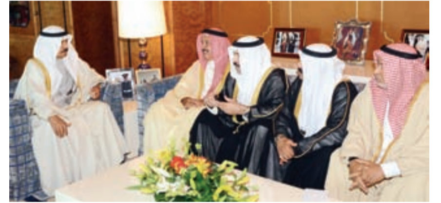
● سمو رئيس الوزراء خلال استقباله اللجنة الأهلية لقرية الدير وسماهيح

أمر صاحب السمو الملكي الأمير خليفة بن سلمان آل خليفة رئيس الوزراء بتوسعة المشروع الإسكاني لقرية الدير وسماهيح وزيادة عدد وحداته السكنية، وتنفيذاً لهذا الأمر الكريم سنتشي وزارة الإسكان 116 وحدة سكنية سيتم طرحها للمناقصة خلال الشهر الجاري، بالإضافة إلى 88 وحدة سكنية و90 قسيمة تم تخصيصها سابقاً.