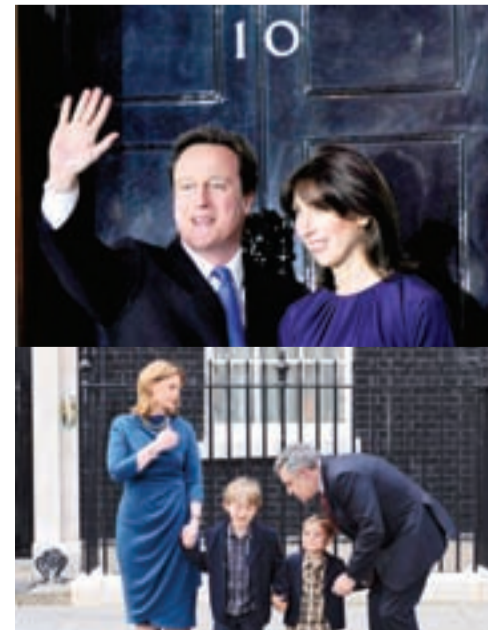
● كاميرون يدخل مقر الحكومة البريطانية بعد مغادرة براون

كاميرون رئيساً جديداً للوزراء في بريطانيا