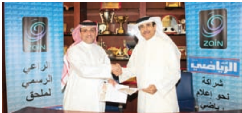
● رئيس مجلس إدارة مؤسسة الأيام ومدير عام زين خلال التوقيع على الاتفاقية

وجاء حديث الوزير رداً على سؤال لـ «الأيام» بشأن ما نشرته وكالة رويترز على لسانه، وكانت الوكالة نقلت عنه أن المحادثات ستطول. وأوضح د. ميرزا أن جميع المفاوضات بشأن استيراد الغاز عندما تصل إلى محور التسعيرة فإنها تستغرق وقتاً، ونبه إلى أن «الروح الإيجابية واضحة في الجانبين، وقد قطعنا شوطاً مهماً في المفاوضات، ومع حسم مسألة التسعيرة يمكننا الحديث عن البدء في إنشاء الأنابيب في الجانبين». ووقعت البحرين اتفاقاً مبدئياً في 2008 لاستيراد ما يصل إلى مليار قدم مكعب يومياً من الغاز الطبيعي من طهران لكن المفاوضات لاتزال جارية.