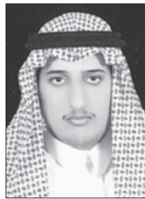
الأمير المعزز بن ناصر

الرياض - مناحي الشيباني أكد صاحب السمو الأمير المعزز بن ناصر بن عبدالله آل سعود أن القرارات الملكية التي أعلنها خادم الحرمين الشريفين لم تأت إلا من ملك الإنسانية والتي طالت إنسانته تلبية احتياجات جميع أبناء شعبه بمختلف طبقاتهم ومستوياتهم العمرية من موظفين وطلاب وعاطلين عن العمل وشملت جميع الخدمات الصحية والمعيشية والتعليمية ومحاربة