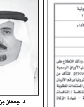
د. جمعان بن رقوش

الرياض - مناحي الشيباني أكد نائب رئيس جامعة نايف العربية للعلوم الأمنية الدكتور جمعان بن رشيد بن قروش أن تلك القرارات الملكية الحكيمة ستصب في دفع عجلة التنمية إلى مواقع متقدمة مما يعزز موقع بلادنا على خريطة النماء العالمي. وأضاف بن قروش في تصريح لـ "الرياض" بقوله