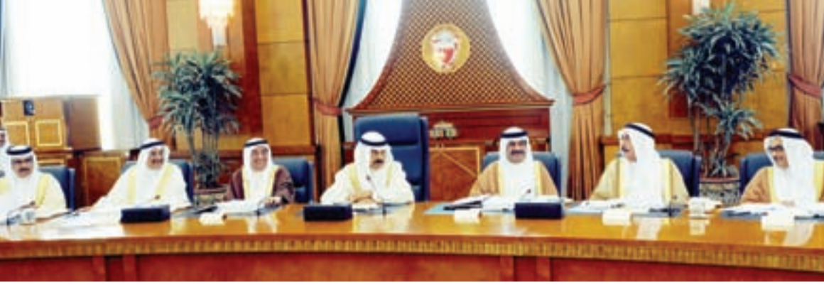
• جانب من جلسة مجلس الوزراء

ومكافحة غسل الأموال بما يتماشى مع توصيات صندوق النقد الدولي ويعزز مكانة مملكة البحرين كمركز مالي ومصرفي متميز يطبق أفضل المعايير والممارسات والنظم والتشريعات الصادرة عن المنظمات والهيئات المالية الدولية المتخصصة وقرر المجلس إحالة مذكرة وزير المالية بهذا الشأن إلى اللجنة الوزارية للشؤون القانونية لدراستها .