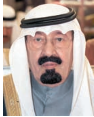
• الملك عبدالله