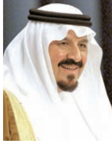
• الأمير سلطان بن عبدالعزيز

إلى ذلك فقد وجه صاحب السمو الملكي رئيس الوزراء إلى تخفيض المشاريع