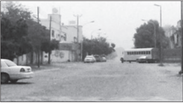
الأجواء الملبدة بالغبار استمرت ثلاثة أيام

عرع- جاسر الصقري تنفيذاً لتوجيهات وزير الصحة الدكتور عبدالله بن عبدالعزيز الربيعية والمتضمن تفعيل آليات مقابلة الجمهور وجولتها بشكل معن ، وتمشيا مع هذه التوجيهات فقد وجه الدكتور محمد بن علي الهدبان مدير عام الشؤون الصحية بالحدود الشمالية بتفعيل وجولة مواعيد مقابلة الجمهور للقيادات الصحية ومدراء المستشفيات بالمنطقة، حيث تم تحديد موعد مقابلات المدير العام ومساعديه يومي السبت والأحد ابتداء من