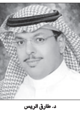
د. طارق الرئيس

والحالية، ولا أدل على ذلك من دعم الأندية الرياضية في الأوامر السابقة وقرارات مكافحة البطالة وتوفير الفرص الوظيفية للشباب ومنح الطلاب مكافأة شهرين في الأوامر الأخيرة إلا أصدق تعبير وأدل برهان على اهتمامه حفظه الله ورعاه بأبنائه شباب الوطن الذين هم بعد الله سبحانه وتعالى الركيزة القوية وخط الدفاع الأول للوطن الغالي. حفظ الله خادم الحرمين الشريفين وأدام عزه ومتعه بالصحة والعافية ووفقه إلى ما يحبه ويرضاه.