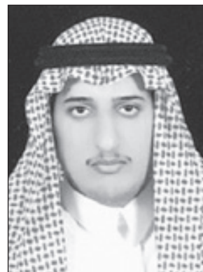
الأمير المعز بن ناصر

وكذلك التوسع في بناء المساجد وأهمية أخذ الفتوى من أصحابها وعدم التسرع ودعم الدعوة والإحسان ولم تقف تلك القرارات عند هذا الشأن بل شملت مراعاة شؤون العاطلين عن العمل وتوفير لقمة العيش لهم حتى يجدوا ما يضمن ويكفي احتياجاتهم. وقال الأمير معز بن ناصر أننا كمواطنين لفخورين بقيادة من يملكه الله خادم الحرمين الشريفين الملك عبدالله بن عبدالعزيز وسمو ولي عهده الأمين وسمو النائب الثاني وزير الداخلية والذي جعل أنظار شعوب العالم تتجه نحونا وربما تحسنا على ما نحن عليه من أمن واستقرار ورخاء في المعيشة فلم يولي خادم الحرمين الشريفين مني ومن جميع مواطني هذه البلاد المباركة خالص الشكر وموفور الدعاء وأن يديم على بلادنا نعمة الأمن والاستقرار.