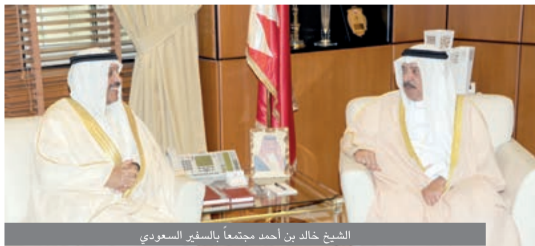
الشيخ خالد بن أحمد مجتمعاً بالسفير السعودي

حضرة صاحب الجلالة من السفير السعودي تضمنت البحرين تقديراً لجهوده في دعم وتعزيز علاقات البلدين شكره وتقديره على تفضله لجلالته بمنحه وسام الشقيقة.