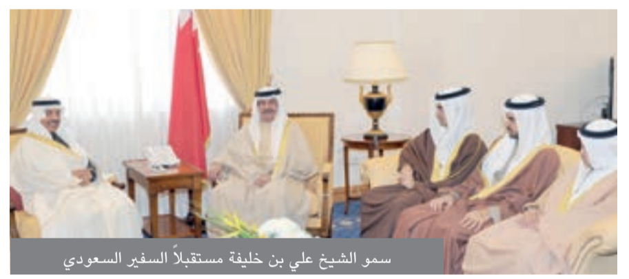
سمو الشيخ علي بن خليفة مستقبلاً السفير السعودي

المملكة العربية السعودية، كما أشاد بعمق العلاقات الأخوية النابعة من الحرص الكبير الذي توليه القيادتان الحكيمتان في البلدين الشقيقين متمنياً للسفير كل التوفيق والنجاح في المهام الجديدة التي أسندت إليه بتعيينه عضواً في مجلس الشورى السعودي داعياً له بالساد والتوفيق لخدمة بلده. وأعرب السفير عن شكره وتقديره لحكومة مملكة البحرين وشعبها الكريم لما حظي به من تعاون وتقدير أسهم بقيامه بعمله الدبلوماسي لما فيه مصلحة البلدين الشقيقين.