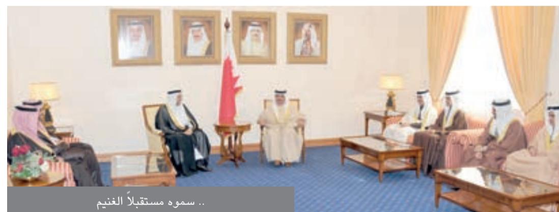
.. سموه مستقبلاً الغنيم

الوزراء عرضاً عن سير العمل في شركة فيفا وبرامجها ومشاريعها المستقبلية معرباً عن شكره وتقديره لسمو الشيخ علي بن خليفة آل خليفة على ما لقيه خلال اللقاء.