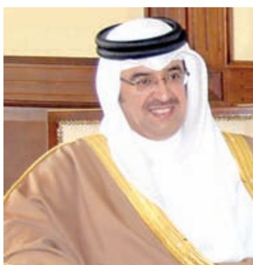
الشيخ حمود بن عبدالله

وإنه ليشرّفني ان أرفع بهذه المناسبة أجمل آيات التهاني إلى خادم الحرمين الشريفين الملك عبدالله بن عبدالعزيز آل سعود، وإلى صاحب السمو الملكي الأمير سلمان بن عبدالعزيز آل سعود ولي عهد الأمين النائب الأول لرئيس مجلس الوزراء وزير الدفاع وإلى صاحب السمو الملكي الأمير مقرن بن عبدالعزيز آل سعود النائب الثاني لرئيس مجلس الوزراء والمستشار والمبعوث الخاص لخادم الحرمين الشريفين وإلى الأسرة المالكة الكريمة والشعب السعودي الشقيق، ونسال الله أن يحقق الآمال المشتركة ويرسخ التواصل ويُعزّز المودة والتعاون الأخوي ويُقرب وصولنا إلى غد مشرق كريم، يجمع دول مجلس التعاون في الخليج العربي على كل خير، ويرتقي بعلاقاتها الوثيقة إلى مستوى الاتحاد المنشود.