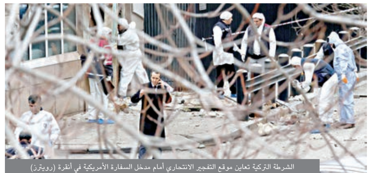
الشرطة التركية تعانين موقع التفجير الانتحاري أمام مدخل السفارة الأمريكية في أنقرة

ودعا نائب الرئيس الأمريكي جو بايدين طهران الى استئناف المفاوضات حول برنامجها النووي على ما نشرت الصحف الالمانية امس في اليوم الذي يبدأ فيه بايدين جولة اوروبية. وفي تصريح لصحيفة سوداتش