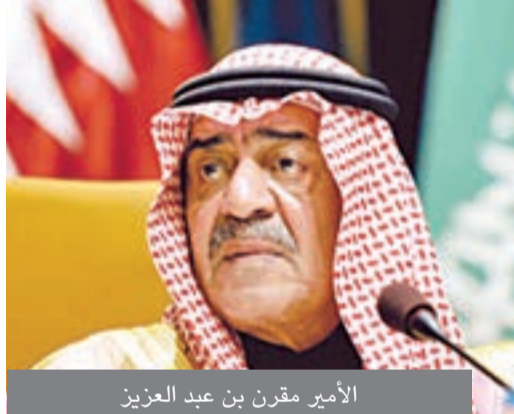
الأمير مقرن بن عبد العزيز

وبعد تركه رئاسة الاستخبارات عمل الأمير مقرن مستشاراً للملك، ويقول دبلوماسيون إنه لعب دوراً في اجتماعات مهمة بين الملك وزعماء أجناب زائرين. وقال خالد المعينا رئيس تحرير صحيفة سعودي جازيت إن الأمير مقرن «يعرف الكثير عن الشؤون الخارجية. آراءه متقبلاً للأفكار الجديدة وللتغيير. إنه يعرف في أي اتجاه يسير العالم».