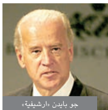
جو بايدن «ارشيفية»

وأعلنت إيران امس الاول تحديث منشأة نطنز التي تعد احد اهم مواقعها النووية، والتي تستخدم اجهزة طرد مركزي قديمة للتخصيب بنسبة 5٪ من نوع «اي آر-1» وهي ابداً من المعدات الحديثة.