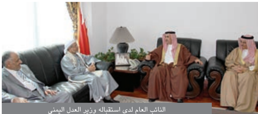
النائب العام لدى استقباله وزير العدل اليمني

في إطار مشاركة وزير العدل بالجمهورية اليمنية القاضي مرشد علي العرشاني والوفد المرافق في أعمال مؤتمر المنتدى العلمي الثاني للشرطة العربية المقام حالياً في المملكة، فقد قام بزيارة مبنى النيابة العامة والالتقاء بالنائب العام الدكتور علي بن فضل البوعينين ودار الحديث بشأن التعاون القضائي القائم بين الجانبين في إطار العلاقات الوثيقة التي تربط مملكة البحرين بالجمهورية اليمنية الشقيقة.