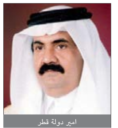
امير دولة قطر

تلقي حضرة صاحب الجلالة الملك حمد بن عيسى ال خليفة رئيس الدورة الحالية للمجلس الأعلى لمجلس التعاون لدول الخليج العربية رسالة خطية جوابية من أخيه صاحب السمو الشيخ حمد بن خليفة آل ثاني امير دولة قطر الشقيقة أعرب فيها عن خالص شكره وتقديره لجلالة الملك على رسالته الاخوية والمتضمنة دعوة سموه للمشاركة في اجتماعات الدورة الثالثة والثلاثين للمجلس الأعلى لمجلس التعاون لدول الخليج العربية، معربا سمو امير دولة قطر عن ثقته بان تحقق القمة برعاية جلالة الملك النتائج المرجوة منها في تعزيز العمل المشترك بين دول المجلس التعاون ودفع مسيرة المجلس نحو تحقيق اهدافه السامية. داعيا سموه الله العلي القدير ان يحفظ قادة وشعوب دول المجلس ويجمعهم دائما على الخير والمحبة، وتمنينا لجلالة الملك المفدى موفور الصحة والسعادة وللشعب مملكة البحرين المزيد من الرخاء والازدهار في ظل قيادة جلالة الملك.