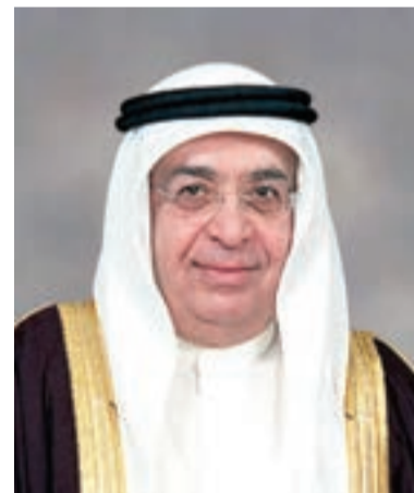
سمو الشيخ محمد بن مبارك