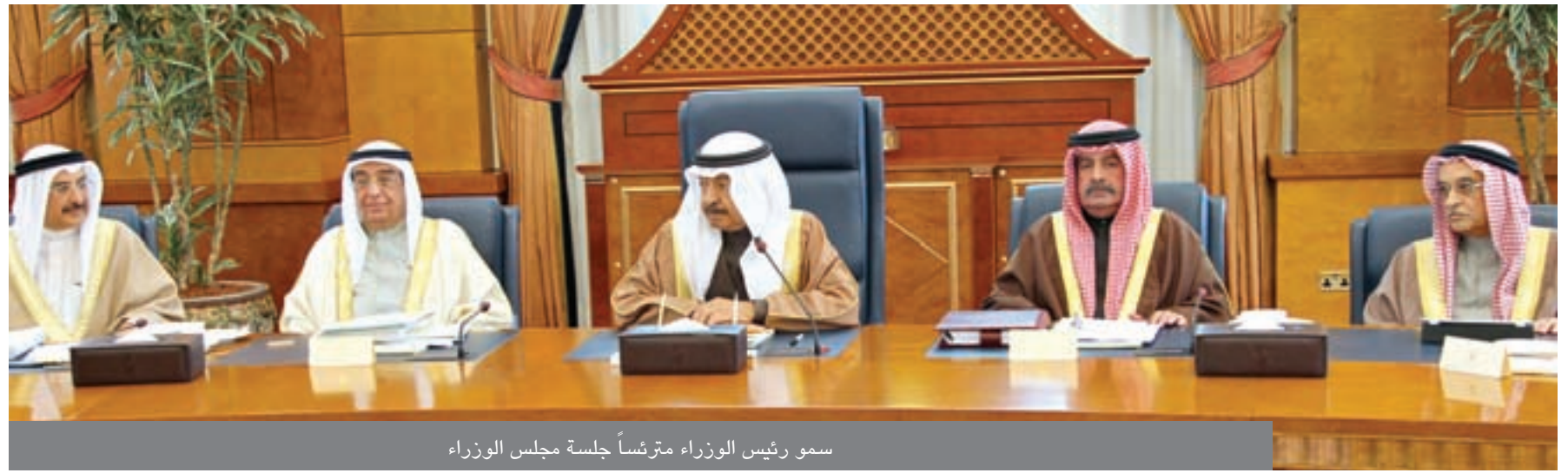
سمو رئيس الوزراء مترشاً جلسة مجلس الوزراء

تلقي صاحب السمو الملكي الامير خليفة بن سلمان آل خليفة رئيس الوزراء برقية شكر جوابية من جلالة الملك بوميبول أوليادج ملك مملكة تايلند الصديقة. وذلك ردا على برقية سموه المهنة له بمناسبة عيد ميلاد جلالتة، اعرب فيها عن خالص شكره وتقديره لسمو رئيس الوزراء على مشاعر سموه الطيبة النبيلة، متمنيا لسموه موفور الصحة والسعادة وللشعب مملكة البحرين المزيد من التقدم والازدهار.