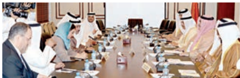
□ وزير الخارجية خلال لقائه عدد من النواب

والتطورات الدولية وما طرحه من تحديات تتطلب تحديد رؤية شاملة على ضوء ما استجد من تطورات وما يجري من أحداث وما يتطلبه الموقف من آليات وتوجهات في المجالات السياسية والأمنية والاقتصادية وذلك تحقيقاً ودعمًا للأمن والاستقرار في المنطقة، مشيراً إلى الجهود الدبلوماسية التي بذلتها مملكة البحرين للتوصل إلى حل سياسي سلمي يحقق للشعب السوري تطعته وآماله ويصون للدولة السورية استقلالها ووحدتها وسلامة أراضيها، ودعم مملكة البحرين للجهود الدولية الرامية إلى إنشاء مناطق آمنة داخل سوريا لحماية المدنيين وتأمين وصول المساعدات الإنسانية. كما تناول وزير الخارجية الأوضاع في العراق وما يشهده من اضطرابات سيكون لها انعكاسات سيئة وخظيرة على المنطقة.