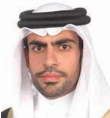
□ محافظ الجنوبية

فريدة؛ من الهمة العالية، والعزيمة الثابتة، والحكمة والبصيرة الناقبة. فنشكر الله أنه خص جلالتمكم بهذه الصفات، فما مَدح الملوك ولا أعطوا شيئاً أعظم من الهمة، ولا استطاعوا أن يبنوا مجداً إلا بعزيمة ثابتة، ولا استقرت بلادهم وقادوا وطنهم إلى الأمن والاستقرار إلا بحكمة وبصيرة ناقبة. حضرة صاحب الجلالة مآترك قائمة ومشهودة لا تحتاج لمثلي أن يُعديها وما جئتُ هنا لأشُردها لأننا نعيشها ظلاً وارفاً وحاضراً نحياها جميعاً. فما أثلت سحابة كرمك إلا وفاضت من غير رعد، وسقت من غير بُحس، وجرى نهرها العذب، ولم تبق أرض إلا رواه ولا نو عطش إلا وسقاه، وذلك كله فضل ساقاه الله على يدك الكريمة، ونعمة من قبل ومن بعد أنعمها الله عليك.