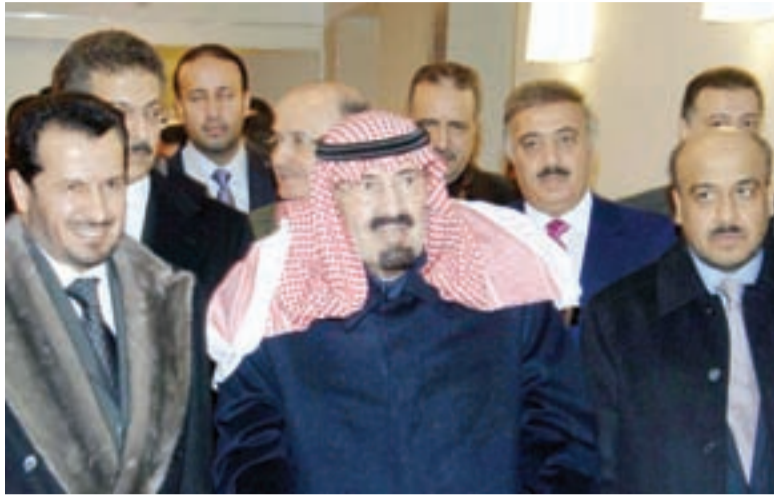
● خادم الحرمين يغادر المستشفى في نيويورك