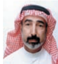
● المطوع يفوز برئاسة المجلس التنفيذي لمنظمة الألكسوا