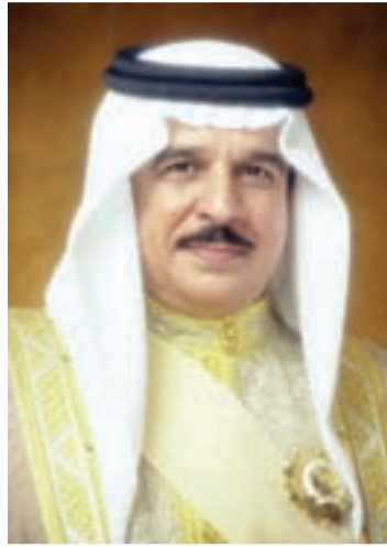
● جلالة الملك