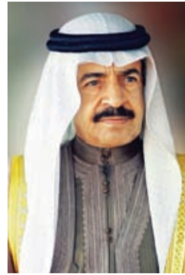
● سمو رئيس الوزراء

وجه صاحب السمو الملكي الأمير خليفة بن سلمان آل خليفة رئيس الوزراء إلى ضرورة إزالة أية عراقيل أو بيروقراطية تؤثر على التنافسية الاقتصادية البحرينية، وتذليل أية عقبات تعترض طريق الانفتاح التجاري والاقتصادي، وأكد سموه أن الحكومة تحرص على المحافظة على اندفاع النشاط التجاري والتوازن بين مصالح التجار وحقوق المستهلكين.