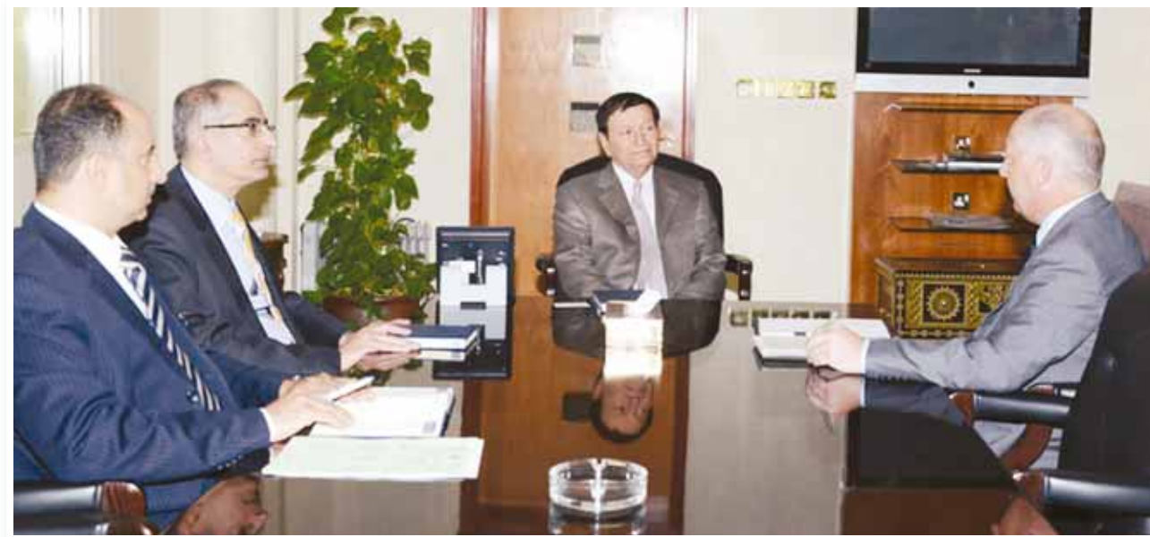
○ وزير الصناعة خلال استقباله مدير مجموعة بانز.

دعم ومساندة وتسهيلات كبيرة وحوافز مشجعة للمستثمرين من جميع أنحاء العالم.