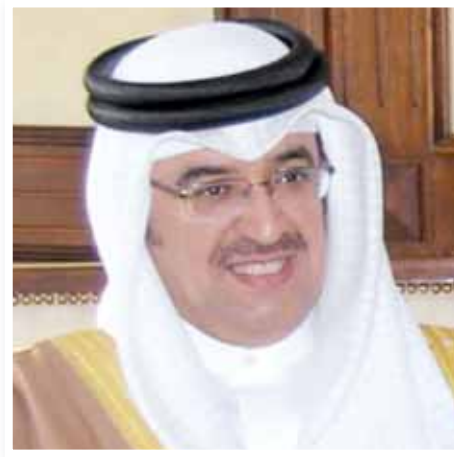
○ الشيخ حمود بن عبدالله .

وعلى المستوى الدولي أكد الشيخ حمود بن عبدالله آل خليفة أن المملكة العربية السعودية لا تألو جهداً في النهوض بمسؤولياتها الكبيرة وأداء دورها الفاعل والمؤثر بنجاح، مشيراً في هذا الصدد إلى التحذيرات السعودية المستمرة من غياب العدالة والمساواة في