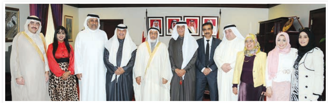
○ رئيس مجلس النواب يستقبل وفد مؤسسات المجتمع المدني للتسامح الديني والمذهبي.

استقبل الفريق الركن الشيخ راشد بن عبدالله آل خليفة وزير الداخلية بمكتبه بديوان الوزارة صباح أمس، الدكتور محمد بن علي كومان الأمين العام لمجلس وزراء الداخلية العرب بحضور وكيل وزارة الداخلية ورئيس الأمن العام.