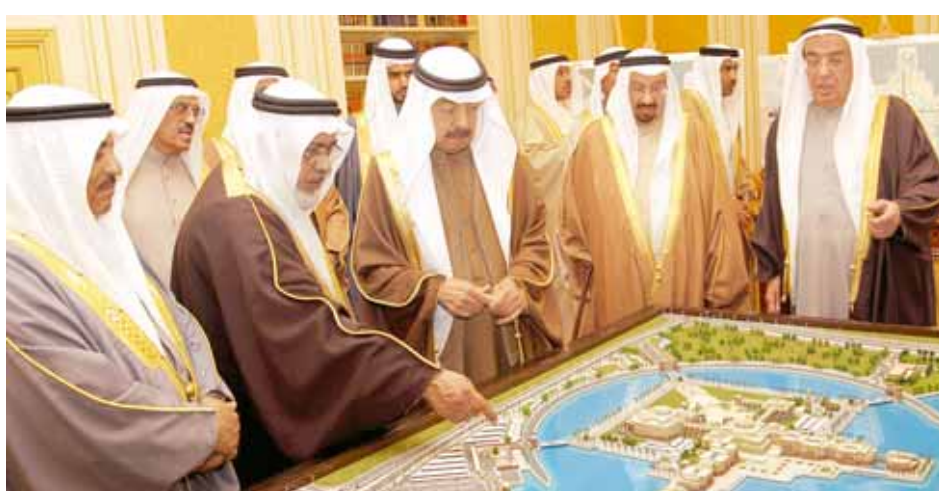
سمو رئيس الوزراء يطلع على مجسم مبنى المجلس الوطني.