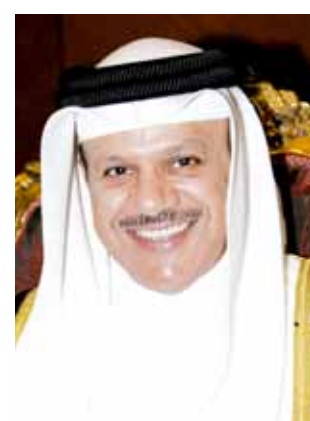
د. عبد اللطيف الزياني.

وقال إن وزراء الخارجية بدول المجلس سيعقدون يوم الأحد اجتماعهم التكميلي لإعداد جدول أعمال الدورة الثالثة والثلاثين والذي يتضمن العديد من الموضوعات المتعلقة بالعمل الخليجي المشترك في مختلف المجالات السياسية والاقتصادية والاجتماعية، وتقارير المتابعة التي تتطلب إقرارها من مقام المجلس الأعلى وأخذ التوجيهات بشأنها، إضافة إلى بحث القضايا السياسية الراهنة الإقليمية والدولية. وأشاد الدكتور عبد اللطيف الزياني في ختام تصريحه بالدور المهم والفعال الذي قامت به المملكة العربية السعودية في ظل رئاسة خادم الحرمين الشريفين للدورة الحالية للمجلس الأعلى لمجلس التعاون، والتي أسهمت في دفع مسيرة التعاون الخليجي المشترك وتحقيق العديد من المنجزات، معرباً عن ثقته بأن هذه المسيرة المباركة سوف تلقى دعم ومساندة حضرة صاحب الجلالة الملك حمد بن عيسى آل خليفة ملك مملكة البحرين خلال ترؤس جلالاته المجلس الأعلى لمجلس التعاون في الدورة القادمة.