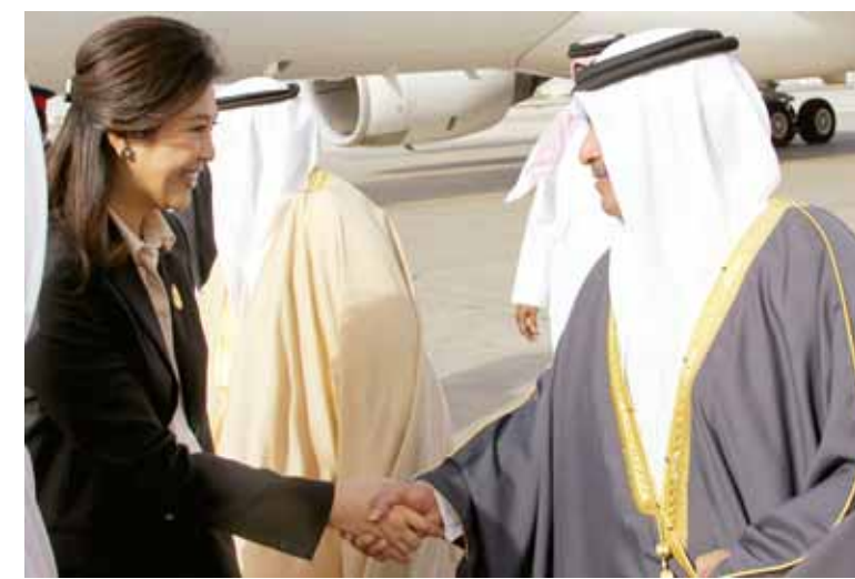
○ سمو الشيخ محمد بن مبارك وسمو الشيخ علي يصفان رئيسة وزراء تايلاند.