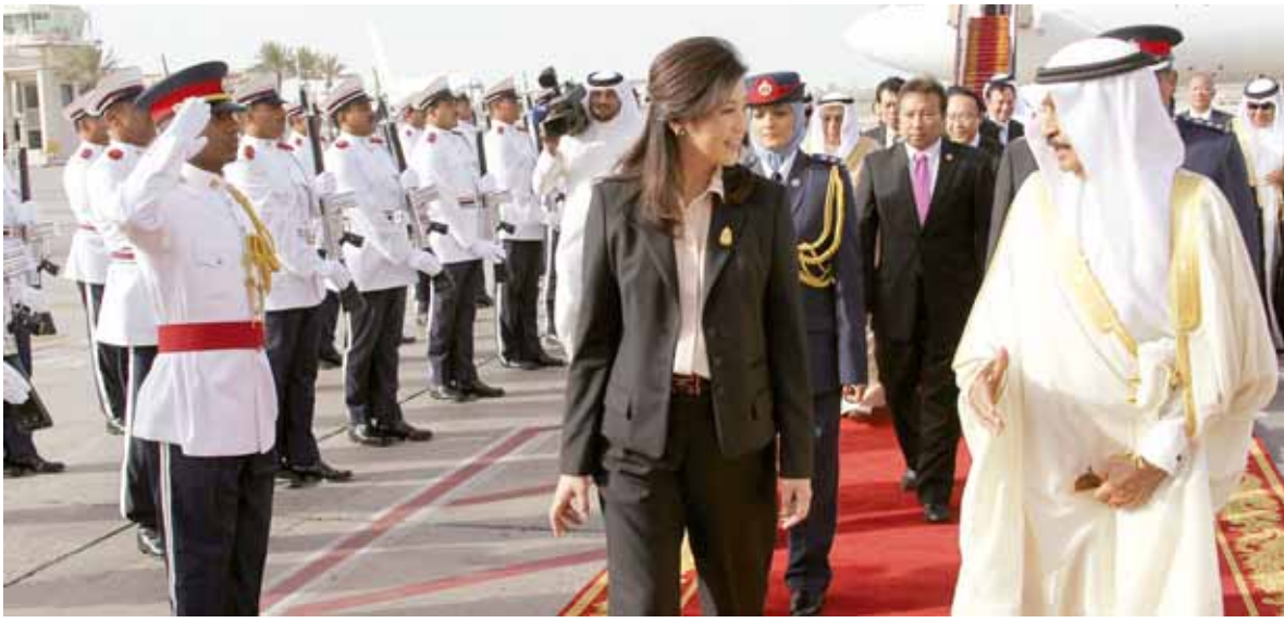
○ سمو رئيس الوزراء يستقبل رئيسة وزراء تايلاند لدى وصولها مطار البحرين الدولي.

وأشاد سمو الشيخ خالد باهتمام ومتابعة صاحب السمو الملكي الأمير سلمان بن حمد آل خليفة ورعايته الكريمة والتي كان لها أظرف الأثر فيما أبداه سمو الشيخ عيسى من تقان وتفوق في هذه الجامعة العريقة. متمنياً له التوفيق والنجاح في حياته العملية القادمة لخدمة ونهضة مملكة البحرين الغالية، وأن يديم على صاحب السمو الملكي ولي العهد الأمين بموفور الصحة والسعادة وطول العمر.