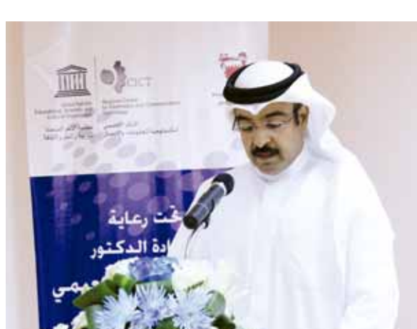
○ الشيخ هشام بن عبدالعزيز.

تحت رعاية وزير التربية والتعليم الدكتور ماجد بن علي النعيمي حضر الشيخ هشام بن عبدالعزيز آل خليفة وكيل الوزارة للموارد والخدمات اللقضاء الثاني للتخطيط الاستراتيجي للمنشآت المحليين من القطاعات العام والخاص وأكبر من قدرة الحكومة على رعايتهم والإنفاق على متطلباتهم وتلبية رغباتهم.. يعني بصراحة قد أصبح لدى البحرين فائض كبير من المتفوقين.. وبمعنى آخر لقد حققت هذه الخطوة الطبية - وأقصد خطوة حرص سمو رئيس الوزراء على تكريم متفوقى الثانوية العامة كل عام - أهدافها بجدارة خلال عدد قليل من السنوات. تأتي إلى مطلب السادة النواب بفصل