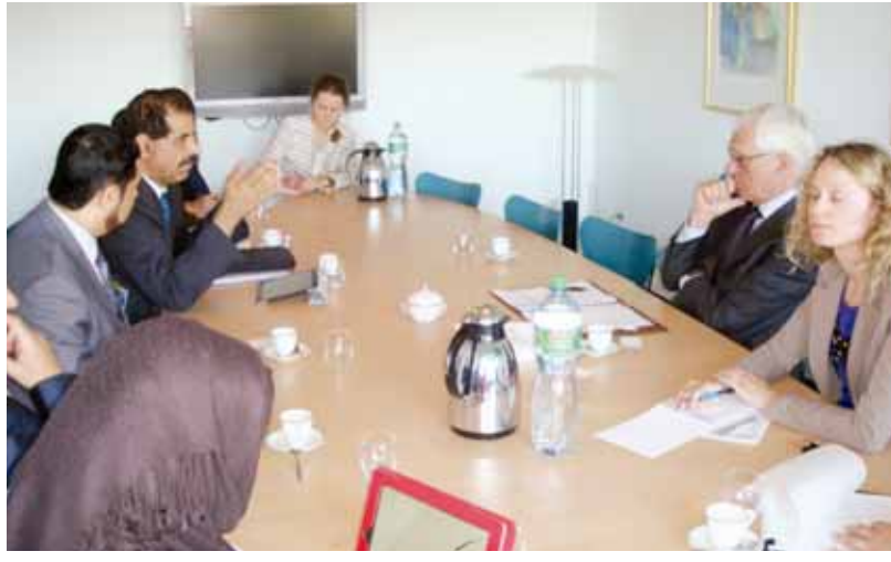
○ د.صلاح علي يلتقي مجموعة من السفراء في جنيف.

كما بين الدكتور صلاح بن علي أن ملكة البحرين دولة قانون يعنى فيها أي انتهاك للقوانين، مشيراً إلى أن ملكة البحرين في الوقت ذاته تقوم بتقديم أي شخص تخيبت عليه ارتكاب جريمة للعدالة.