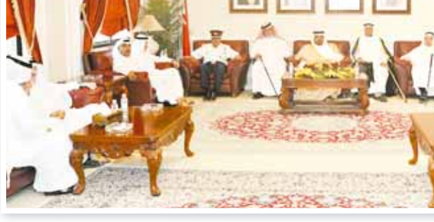
○ مجلس محافظ الوسطى

وذكر أن صيد القبايق في البحرين أخذ منحى كبير في التآخير على المخزون من سرطان البحر على الرغم من إقبال البحرينيين