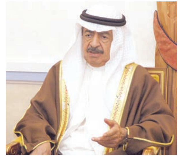
O سمو رئيس الوزراء.