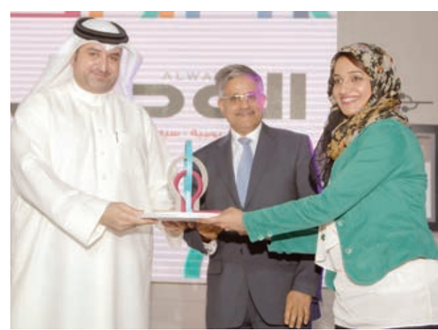
O تكريم أمانة النواب.

للاستفسار يمكن الاتصال على الأرقام المدونة أدناه، هاتف رقم 17558313 - 17698688 - فاكس رقم 17550371 ص.ب. 21332 المنامة - مملكة البحرين