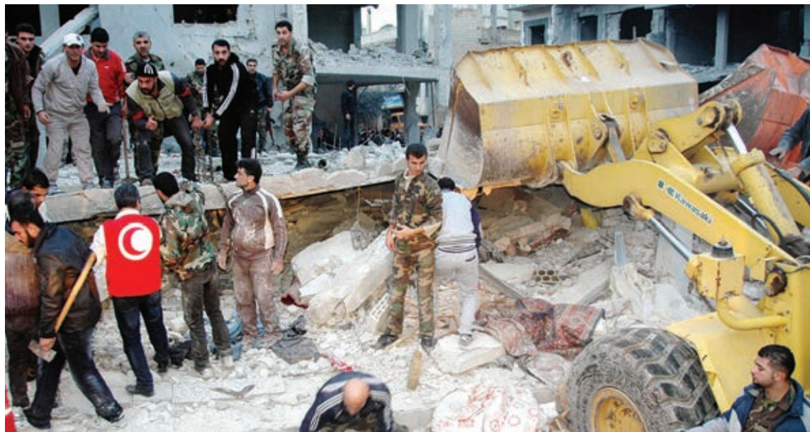
( أ ف ب ) ○ حطام مبنى دمره القصف في حمص.

وتحدث عن ضرورة استئناف المفاوضات من حيث توقفت مع الأخذ بعين الاعتبار التفاهات الكثيرة، التي تم