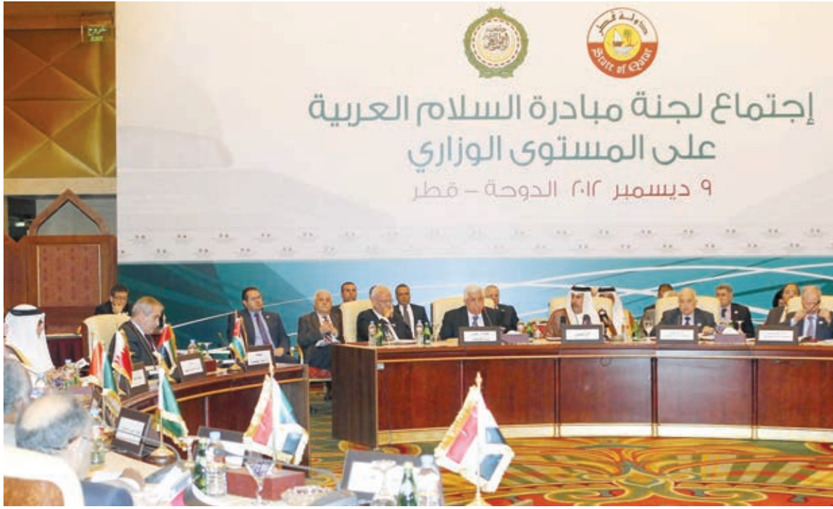
( أ ف ب ) ○ اجتماع لجنة مبادرة السلام العربية بالدوحة.

وتقدم البيان بالشكر لكل دول العالم التي صوتت لصالح مشروع القرار برفع مكانة فلسطين في الامم المتحدة على حدود ١٩٦٧ وباعتبارها القدس الى دولة مراقب (غير عضو)، بحسب البيان الذي «حث مجلس الامن على الاسراع في البت في طلب حصول فلسطين على العضوية الكاملة في الامم المتحدة».