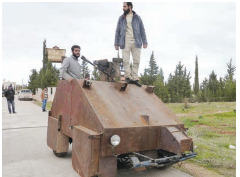
( أ ف ب ) ○ مدرعة صنعتها مقاتلون من بلدة شفاعتين بـحلب.