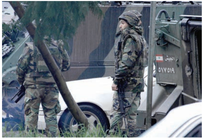
( أ ف ب ) ○ عناصر أمنية في إحدى مناطق طرابلس.

في الموضوع نفسه، نشر ناشطون سوريون على موقع يوتيوب على الانترنت شريط فيديو قالوا انه لأجسامين شهداء طرابلس الشمام الذين تركوا أقدام تركل الجثث، وهاجروا الى سوريا للدفاع عن اعراض المسلمين ووقفوا في كمين غادر للعصابات