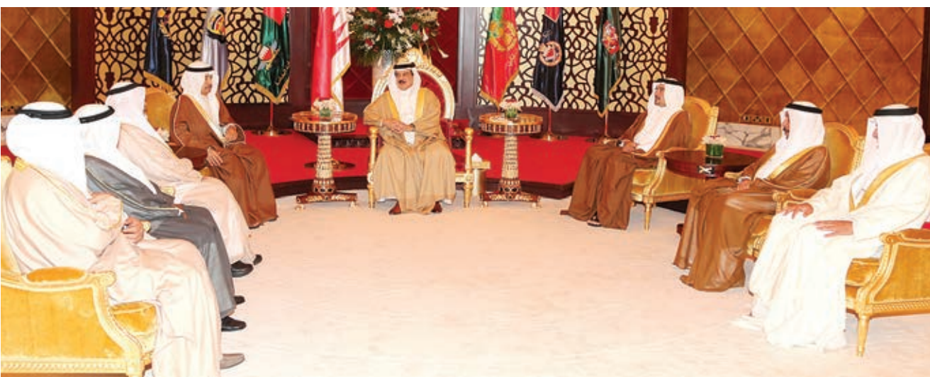
العاهل المفدى لدى استقبال ممثل السلطات الثلاث.

جلالته يشيد بجهود السلطة التنفيذية لتحقيق تطلعات الشعب السلطة التشريعية عززت الحياة الديمقراطية.. والقضائية أكدت مبادئ الحق والعدالة