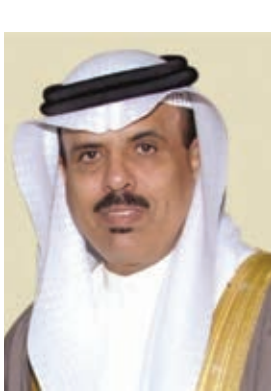
د. ماجد النعيمي وزير التربية والتعليم أن البعثات التي توفرها الوزارة تراعي احتياجات المملكة مع مراعاة مصلحة الطالب، مشدداً على ضمان المنافسة السليمة بين جميع الطلبة، في ظل الأعداد التي تتقدم إلى هذه البعثات في التخصص نفسه.

تنفذها الوزارة عبر المقابلة الشخصية والامتحانات التحريرية من أجل اختيار أفضل العناصر التي تلبى الاحتياجات، فإذا لم نجد العنصر البحريني المؤهل نلجأ إلى التعاقد الخارجي، وهو تعاقد محدد بعام واحد فقط نسعى من خلاله لاستقطاب أفضل الكفاءات عبر الاختبارات وفقا لنظم الإعارة من دولهم، وذلك وفقا للقانون والنظام بما يحفظ كرامة الجميع.