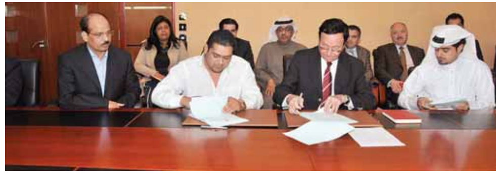
○ وزير الصناعة يوقع العقد.

وللسثمرين من جميع أنحاء العالم، مقدراً جهود القيادة ووزارة الصناعة والتجارة في مجال استقطاب الراسمیل الأجنبية والمشاريع ذات العوائد الاقتصادية الضخمة على مملكة البحرين. وتبقى مملكة البحرين نقطة جذب للمشاريع والشركات بصورة مستمرة ومتزايدة.