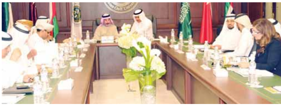
جانب من اجتماع مجلس أمناء الخليج العربي.

ومجالات العلوم والتقنية. ناقش المجلس تفاصيل مشروع مدينة الملك عبدالله الطبية، والمرحلة التي قطعها المشروع وفق الخطة الزمنية الموضوع، بعد أن خصص خادم الحرمين الشريفين الملك عبدالله بن عبدالعزيز آل سعود مليار ريال سعودي لإنشاء المدينة الطبية التابعة لجامعة الخليج العربي، قابلتها هيئة أخرى من جلاله الملك حمد بن عيسى آل خليفة بتخصيص أرض بمساحة مليون متر مربع تسلمت إدارة الجامعة وثيقته قبل بضع أشهر. وأوضح الدكتور العوهلي أن مشروع المدينة الطبية الذي تمت المرحلة الأولى منه وفق الخطة الزمنية المحددة، يعكس التعاون بين الأشقاء في دول مجلس التعاون لدعم الجامعة والمجتمع الخليجي ككل، موضعاً للأعضاء أن مشروع المدينة الطبية يتضمن ثلاث مراحل أساسية، في مرحلة دراسة الاحتياجات من حيث نوعية الاختصاصات التي ستوفر في المستشفى وعدد الأطباء والمرضى والجهاز الطبي وأسلوب ونموذج الإدارة ودراسة سيرانية المدينة الطبية والاحتياجات التقنية للمدينة في المرحلة الأولى، لتدرس المرحلة الثانية تصميم المباني بالمدينة، ثم مرحلة التشييد والبناء في المرحلة الثالثة، مشيراً في الوقت ذاته إلى أن العمل في مشروع العيادات الطبية الخارجية سيبدأ بإذن الله تعالى في الربع الأول من السنة الجديدة.