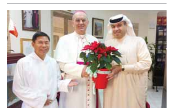
زيارة الواكب الحسينية للكتيبة.

برعاية الفريق طبيب الشيخ محمد بن خالد آل خليفة وزير الدولة لشؤون الدفاع أقامت جمعية الكلمة الطيبة، عضو الاتحاد العربي للعمل التطوعي بمشاركة الجمعية السعودية للعمل التطوعي ولجنة خدمة المجتمع بشركة المينوم البحرين (البا) وبحضور عدد كبير من المسؤولين والشخصيات الوطنية المهمة احتفالاً كبيراً، حيث تم خلال هذا الحفل تكريم بنك البحرين والكويت وتقدير أومر فنانا لدوره الرائد والمتميز في دعم حركة العمل الفعاليات. التطوعي والاجتماعي في مملكة البحرين وبالأخص الأنشطة ومشاريع جمعية الكلمة الطيبة، فقد تفضل راعي الغفل وزير الدولة لشؤون الدفاع بتقديم التكريم والهدية التذكارية إلى السيد عبد الكريم أحمد بوجيري الرئيس التنفيذي لبنك البحرين والكويت والتي تعبر عن الاعتزاز والفخر لبنك البحرين والكويت لريادته ودعمه اللامحدود للمجتمع في مملكة البحرين ما كان له الأثر الاكبر في نجاح وإبراز هذه الفعاليات.