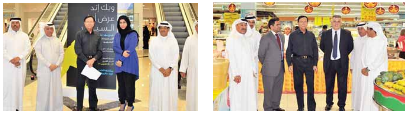
○ وزير الصناعة خلال جولته بالأسواق .

تنوع مصادر الاستيراد والتسهيل على المستهلكين من خلال توفير كل متطلباتهم من المنتجات المختلفة التي تتنوع لهم فرصا أكبر للاختيار وهذا ما يتوافر في الأسواق الكبيرة والمجمعات التجارية التي تعزز استقرار السوق وتسهم في خفض الأسعار وتنشيط حركة السوق المحلي.