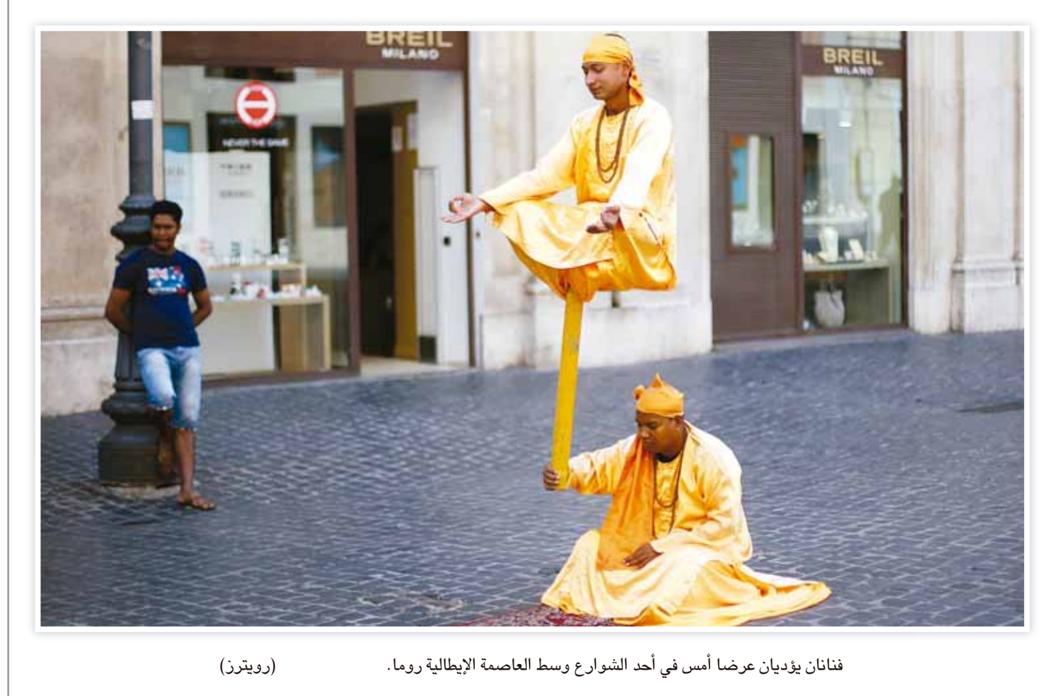
فنانان يؤديان عرضاً أمس في أحد الشوارع وسط العاصمة الإيطالية روما.

تشهد مدينة الأقصر التاريخية بصعيد مصر يوم غد الأحد احتفالية مصرية سعودية لوضع اسم صورة العاهل السعودي الملك عبدالله بن عبدالعزيز على أكبر ميادين المدينة والمعروف حالياً باسم ميدان التجارة تقديراً لمواقفه المشرفة تجاه مصر. أعلن اللواء علاء