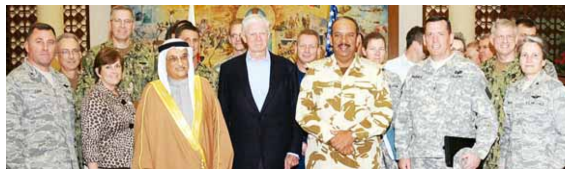
○ القائد العام خلال لقاء الوفد.

اجتمع المشير الركن الشيخ خليفة بن أحمد آل خليفة القائد العام لقوة دفاع البحرين في مكتبه بالقيادة العامة صباح أمس الأربعاء ١٣ فبراير ٢٠١٣ م مع وفد من جامعة الدفاع الوطني الأمريكية برئاسة الفريق أول مقاعد جوزيف هور (Joseph Hoar). وخلال الاجتماع رحب القائد العام لقوة دفاع البحرين بوفد جامعة الدفاع الوطني الأمريكية، حيث استعرض مع الوفد علاقة التعاون والتنسيق، إلى جانب بحث عدد من المواضيع ذات الاهتمام المشترك.