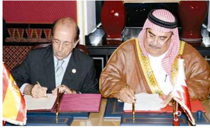
○ الشيخ خالد وزير الدولة للشؤون الخارجية الإسباني يوقع المذكرة.

اجتمع الشيخ خالد بن محمد آل خليفة وزير الخارجية أمس مع عدد من وزراء الخارجية بدول الاتحاد الأوروبي كل على حدة، معالي السيد تاينوس كورليتان وزير خارجية رومانيا، وأيونيس كاسوليدس وزير خارجية جمهورية قبرص، وإدغارز رنكفكس وزير خارجية جمهورية لاتفيا، وجورج فيلا وزير خارجية مالطا، وأرملي بيت وزير خارجية جمهورية أستونيا الديمقراطية، ولاينوس لخنغيشيوس وزير خارجية ليتوانيا، وغونخالو دي بينتو وزير الدولة للشؤون