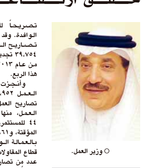
○ وزير العمل.

تصريحاً للملتحقين بالعمالة الوافدة. وقد شهد عدد تجديدات تصاريح العمل ارتفاعاً من ٣٩,٧٥٤ تجديداً في الربع الثاني من عام ٢٠١٣ إلى ٤٦,٥٦١ في هذا الربع. وأُنجزت هيئة تنظيم سوق العمل ٢٧,٩٥٢ طلباً لإنهاء تصاريح العمل من قبل أصحاب العمل، منها ٢٣,٠٤٢ للعمالة، ٤٤ للمستثمرين، و٩٠٥ للعمالة المؤقتة، و٣,٩٦١ طلباً للملتحقين بالعمالة الوافدة. وقد استمر قطاع المقاولات في تسجيله أعلى عدد من تصاريح العمل الجديدة محققاً بذلك نسبة ٣٢٪ من مجموع تصاريح العمل الصادرة، يتبعه قطاع البيع بالجملة والتجزئة بنسبة ٢٤٪، ومن ثم قطاع الصناعة بنسبة ١٢,٦٪. وبالنسبة إلى طلبات انتقال العمالة الوافدة إلى صاحب عمل جديد فقد بلغ مجموعها ١٠,٦٢٤ معاملة، فيما بلغت نسبة طلبات الانتقال بعد انتهاء تصاريح العمل ٥٧٪ من مجموع الطلبات بالمقارنة مع ٥٤٪ للنفس الفئة في الربع السابق، في حين بلغت نسبة طلبات الانتقال مع موافقة صاحب العمل السابق ٤٣٪، أما نسبة طلبات الانتقال من دون موافقة صاحب العمل السابق فكانت أقل من ١٪، وهو معدل طبيعي مقارنة بحركة الانتقال في