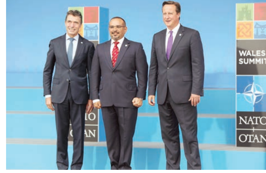
○ سمو ولي العهد يتوسط رئيس وزراء بريطانيا والأمين العام لحلف الناتو.

أكد صاحب السمو الملكي الأمير سلمان بن حمد آل خليفة ولي العهد نائب القائد الأعلى النائب الأول لرئيس مجلس الوزراء ضرورة الشراكة الدولية في محاربة مخاطر الإرهاب بفعالية وحزم لأنه لا حدود له في تهديداته ومخاطره، مؤكدا سموه أن هذا يستوجب أن تقرن الاستراتيجيات الأمنية والدفاعية مع استيعاب العوامل والأسباب التي توفر بيئة خصبة لتفاقم الإرهاب وأن يتم استباق العمل عليها عبر اتخاذ نهج فاعل ومؤثر. وأضاف سموه أن مملكة البحرين أدرت منذ مرحلة مبكرة أهمية التنسيق وتكامل الجهود لتدعيم المساعي والخطوات للتصدي الحازم لمخاطر الإرهاب بكل أشكاله، وخاصة مع تزايد أهميته في الفترة الراهنة مع تفاقم مظاهر الإرهاب وتهديده في دول عديدة بالمنطقة والعالم. وقال سموه إن مملكة البحرين - وفق توجيهات جلالة الملك المفدى - مستمرة في تعزيز التعاون والتنسيق الفاعل مع المنظمات الدولية المختصة مثل منظمة حلف شمال الأطلسي (الناتو) التي تغطي عملها نطاقاً جغرافياً واسعاً في حفظ الأمن والسلام، واستعداد مملكة البحرين لدعم مهامها عبر مختلف القنوات، وهو ما يوظره انضمام مملكة البحرين إلى مبادرة اسطنبول للتعاون التي توفر منصة رسمية للتعاون مع منظمة الناتو في مثل هذه المجالات المهمة. وأشار سموه إلى أن هناك فرصاً وإمكانات