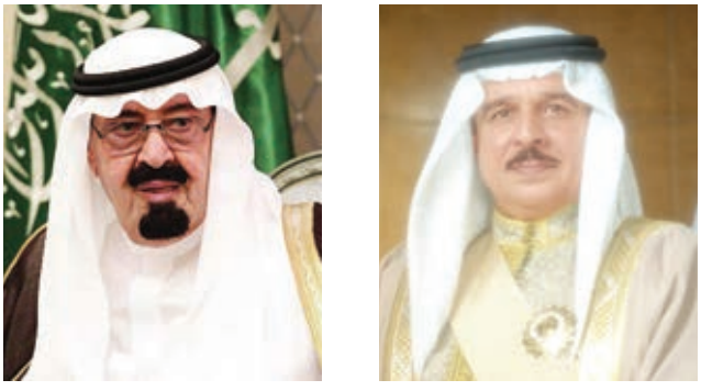
○ خادم الحرمين. ○ جلالة الملك.