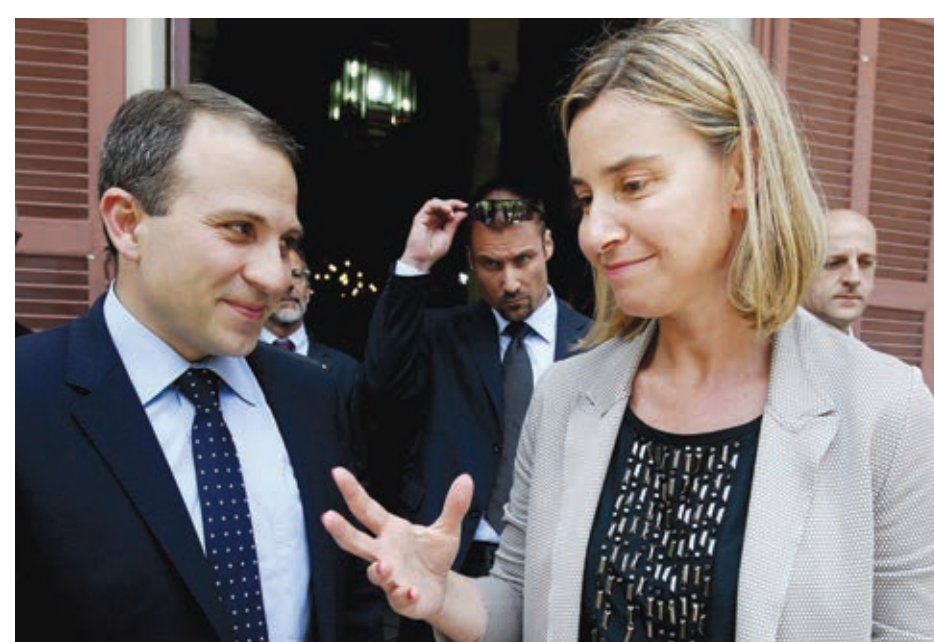
الوزيرة الإيطالية تتحدث إلى نظيرها اللبناني لدى مغادرتها مبنى الخارجية ببيروت. (أ ب)

وذكرت موغيريني أن دول ومنظمات دولية عدة ستشارك في المؤتمر الذي «لن يكون مؤتمر مانحين، بل يهدف إلى إبراز الدعم السياسي الكامل من المجتمع الدولي للقوات المسلحة». وأضافت: «نحن نذكر في إيطاليا، واعتقد أن بقية دول العالم تترك هذا أيضا، أن دعم الجيش اللبناني أمر مهم، أولا لأنه يشكل مؤسسة توحده البلد، وثانيا لأنه أداة لإرساء الأمن في بلد يعرف نزاعا على حدوده».