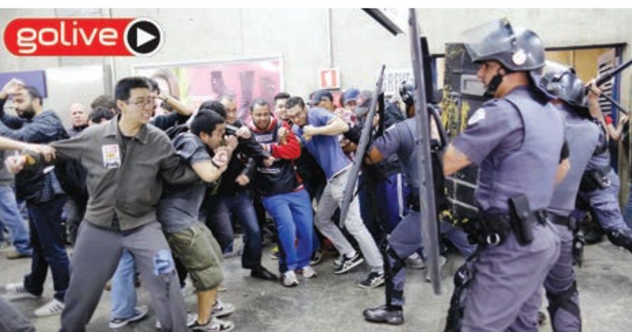
نشطاء وعامل مذبوحون يتواجهون مع الشرطة في محطة للمترو في ساو باولو.

وتكون مدة الخدمة سنتين للحاصلين على مؤهل أقل من الثانوية العامة وتسعة أشهر للحاصلين على شهادة الثانوية العامة فأعلى.