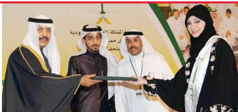
○ السفير السعودي يكرم إحدى المتفوقات.