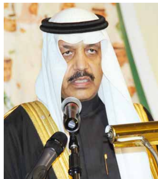
○ السفير عبد المحسن بن فهد المارك.

ولفت إلى أن المحفظة الثقافية بالسفارة كان يطلق عليها اسم المحفظة