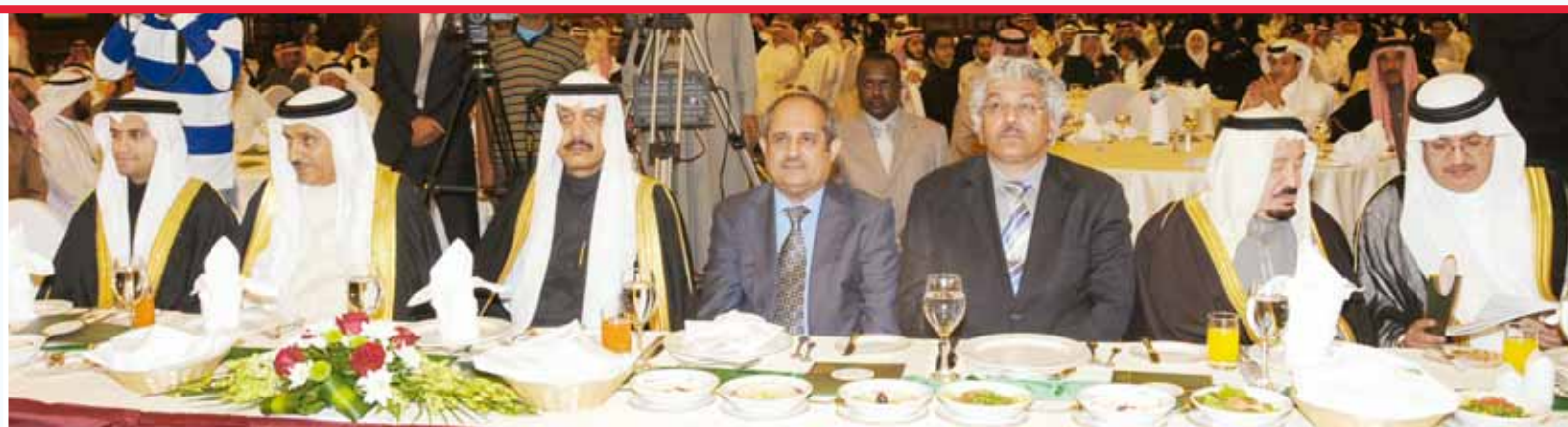
○ كبار الحضور خلال حفل التكريم.