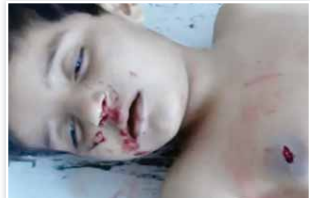
○ طفل قتل في قصف على حي الخالدية في حمص.

دمشق - الوكالات: تلقى الوفد الخاص للأمم المتحدة والجامعة العربية إلى سوريا كوفي عنان أمس الاثنين ردا جديدا من السلطات السورية على خطته السداسية النطاق لحل الأزمة السورية، كما لقي دعما قويا لخطته من الولايات المتحدة وروسيا، في الوقت الذي واصلت فيه القوات النظامية السورية هجماتها في العديد من المناطق السورية.