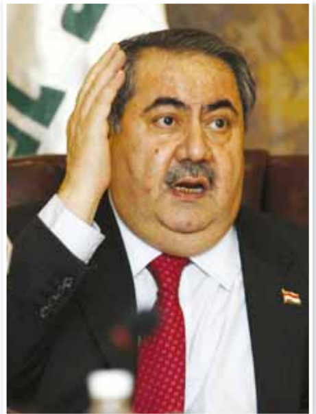
○ زيباري يتحدث في المؤتمر الصحفي.

وتابع «لا اعتقد انه ستكون هناك دعوات الى بشار الأسد للتخلي، لكننا سندعم مسارا سياسيا وتغييرا سياسيا يقود نحو تغيير النظام بطريق سلمية، وهو تغيير بقيادة سورية».