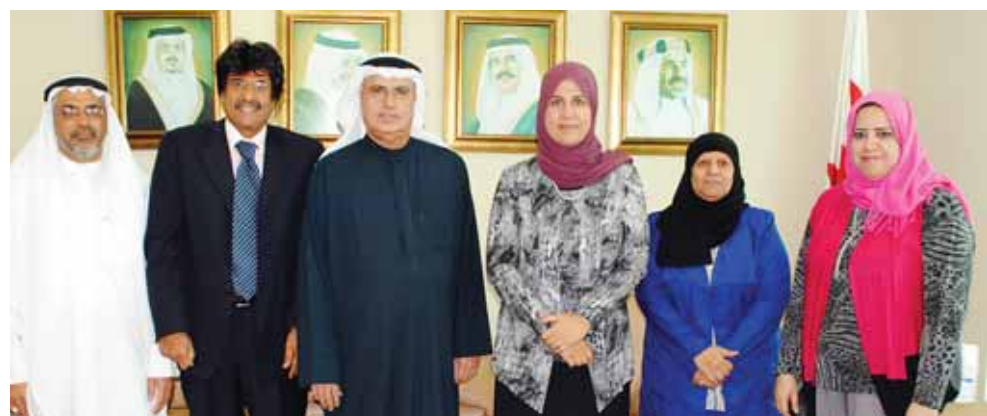
○ خلال الاستقبال.

الكثيرة والكبيرة بين دول مجلس التعاون، مشيرة إلى أن احتضان المملكة لمقر المكتب منذ تأسيسه يُعبر عن رؤية بحرينية لدعم المشاريع التنموية الخليجية ولأهمية دورها في مختلف المجالات والأصعدة. من جهته أعرب المهيري عما حققته وزارة حقوق الإنسان والتنمية الاجتماعية من تطوير متسهمود في عمل الوزارة ونشاطاتها التي شملت مختلف جوانب الحياة الاجتماعية في مملكة البحرين ومواصلة مسؤوليتها الوطنية في تقديم أفضل الخدمات الاجتماعية والرعاية للمواطنين من أجل تحقيق الاستقرار الاجتماعي ونماء أفراد.