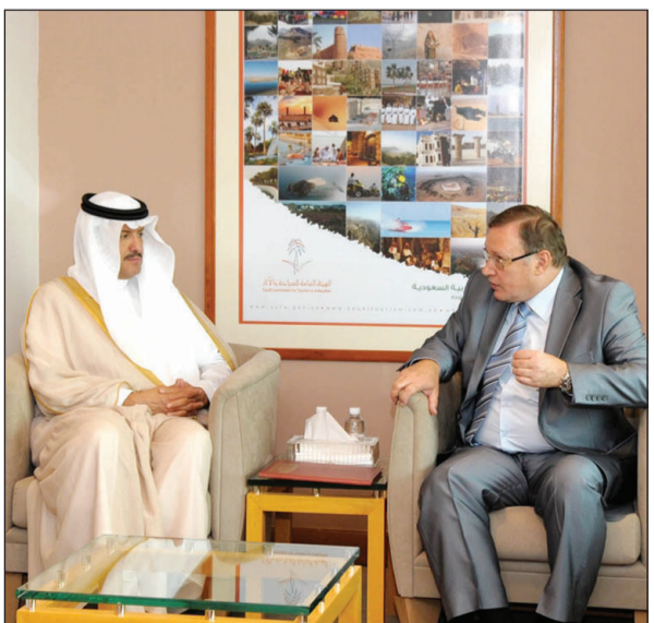
الأمير سلطان بن سلمان مستقبلاً السفير الروسي

الرياض - واس □ استقبل صاحب السمو الملكي الأمير سلطان بن سلمان رئيس الهيئة العامة للسياحة والآثار أمس الاثنين في مقر الهيئة في الرياض سفير جمهورية روسيا الاتحادية لدى المملكة أوبليغ بوريسوفيش أوزيروف. وجرى خلال اللقاء بحث عدد من الموضوعات ذات الاهتمام المشترك والتعاون القائم بين البلدين في المجالات السياحية والآثار والتراث العمراني وسبل تطوير هذا التعاون.