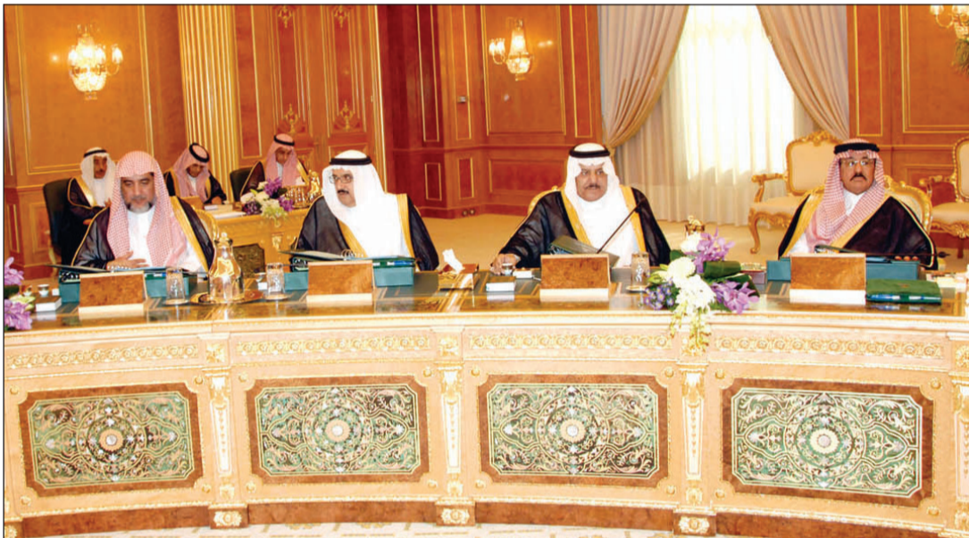
الأمير نايف خلال الجلسة

له وذلك في ضوء الصيغتين المرفقتين بالقرار ومن ثم رفع النسخة النهائية الموقعة لكل منهما لاستكمال الإجراءات النظامية . خامساً: وافق مجلس الوزراء على إعادة تشكيل مجلس الضمان الصحي التعاوني لمدة ثلاث سنوات تبدأ من ١٦/١٠/١٤٣١ هـ وذلك برئاسة معالي وزير الصحة وعضوية كل من : ١. صاحب السمو الأمير الدكتور بندر بن عبدالله بن محمد بن مقرن المشاري آل سعود ممثلاً عن وزارة الداخلية. ٢. معالي الدكتور بندر بن عبدالمحسن القناوي ممثلاً عن القطاعات الصحية الحكومية ٣. الدكتور منصور بن ناصر الحواسي ممثلاً عن وزارة الصحة ٤. الدكتور محمد بن يحيى الشهري ممثلاً عن القطاعات الصحية الحكومية ٥. الدكتور عبدالرحمن بن عبدالمحسن الخلف ممثلاً عن وزارة المالية ٦. عثمان بن صالح الحقييل ممثلاً عن وزارة العمل ٧. أحمد بن عبدالرحمن العبد العالي ممثلاً عن وزارة التجارة والصناعة ٨. المهندس لؤي بن هشام ناظر ممثلاً عن مجلس الغرف الصناعية السعودية ٩. علي بن سليمان العايد ممثلاً عن شركات التأمين التعاوني. ١٠. الدكتور سامي بن عبدالكريم العبدالكريم ممثلاً عن القطاع الصحي الخاص